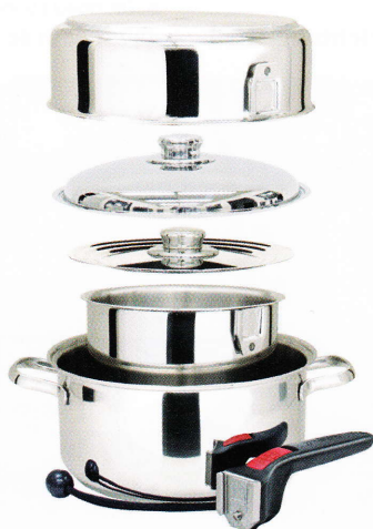
Kompaktes Topfset für die Pantry.

Das Kochgeschirr wird zu einem empfohlenen Verkaufspreis von 169,- Euro angeboten.